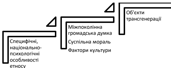
Рис. 3. Системотворчі фактори трансгенерації етнічної моральної культури

культури. Наші дослідження щодо проблеми трансгенерації підтверджують важливе місце моралі, як одного з об'єктів трансгенерації. Щодо факторів культури автор визначає наступні: мета як інтегратор системи; розуміння ідеї про ідеальну особистість; час, період в їх становленні; загальний культурний рівень розвитку етносу; міжпоколінська громадська думка; соціальна пам'ять етнічної, національної самосвідомості; національна ідея (рис. 3).