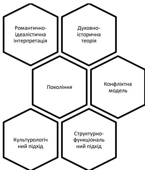
Рис. 1. Гуманітарне знання узагальнення трансгенераційної проблематики

- культурологічний підхід, який дозволяє осмислювати протиріччя способу життя, цілей, мотивів поведінки, аналізувати субкультуру протесту, протиріччя соціального успадкування та наступності культур (К. Манхейм).