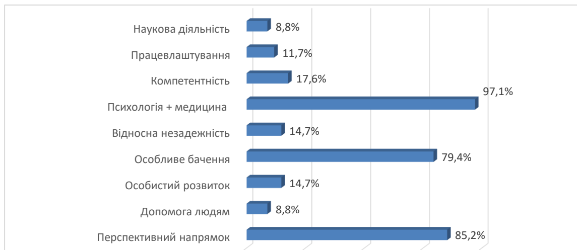
Рис.1. Сильні сторони обраної професії.

Виходячи з показників слабких сторін отриманих нами в ході проведення методики, можна зробити висновок, що найважливішим для формування негативного погляду на образ майбутньої професії для більшості учасників дослідження є: відсутність розуміння, правильного сприйняття та залученості на національному та державному рівні (97,05%), відсутність бажаної кількості та варіабельності робочих місць, високий рівень конкурентності за рахунок психологів без вищої освіти або психологів без медичної освіти (91,17%), нервова напруга, відповідальність та стрес, викликані страхом перед відповідальністю та