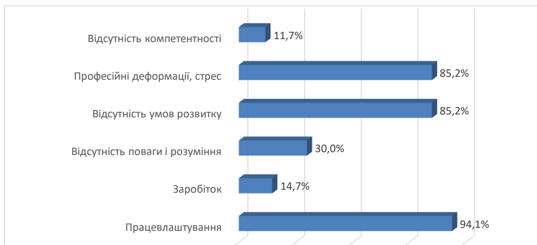
Рис.5. Загрози в обраній професії.

За результатами аналізу показників загроз, можна зробити висновок, що перешкодами, які впливають на зниження вмотивованості для здобуття майбутньої професії для більшості учасників дослідження є: висока конкурентність за рахунок психологів без медичної освіти, або вищої освіти, відсутність робочих місць при лікарнях, а тому проблеми з працевлаштуванням (94,1%), відсутність поваги до професії, розуміння з боку держави та суспільства важливості професії лікаря - психолога у сучасному світі (88,23%), недостатність умов для розвитку, яка полягає в фінансовій неспроможності та в недостатній правовій та науковій підготовленості (85,2%), страх перед відповідальністю, професійними деформаціями та стресом, який супроводжує діяльність (85,2%), недостатня заробітна платня в державних закладах, незадовільна заробітна платня на перших етапах кар'єрного зростання (14,7%), відсутність компетентності за рахунок складності акредитації на міжнародному рівні (11,7%).