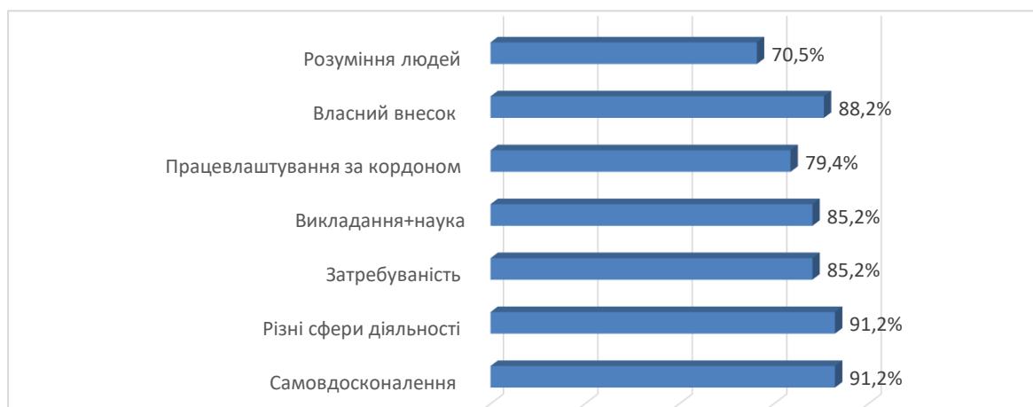
Рис. 4. Можливості обраної професії.

За результатами аналізу показників можливостей у нашому дослідженні ми зробили висновки, що мотивація здобуття майбутньої професії відображається в тих можливостях, які вона може дати респондентам: самовдосконалення за рахунок навчання та інтеграції у практичне застосування отриманих навичок, зокрема, таких як навички навчання та самодисципліни, навички в сфері розуміння людського тіла та психіки, навички роботи з людьми (91,17%), праці у різноманітних галузях, не обмежуючись медициною чи психологією (91,17%), можлива затребуваність у різноманітних сферах діяльності, тобто висока можливість успішного працевлаштування, вибору та зміни місця праці (85,2%), викладання у вищих учбових закладах, створення кар'єри у науковій сфері, написання книг, статей, наукових робіт (85,2%), власного внеску у створення нових посад, шляхів застосування здобутих навичок, методик, позитивний вплив на сприймання професії, маркетинг, інтеграція у бізнесі (88,23%), більш глибокого розуміння людської психіки, поведінки, що допомагає у інтимному та повсякденному житті, у спілкуванні та налагодженні взаємовідносин з соціумом (70,5%) (Рис.4).